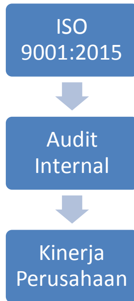
Gambar 2.1 Kerangka Pemikiran

Berdasarkan penjelasan di atas, maka dapat di tarik kerangka pemikiran sebagai berikut :