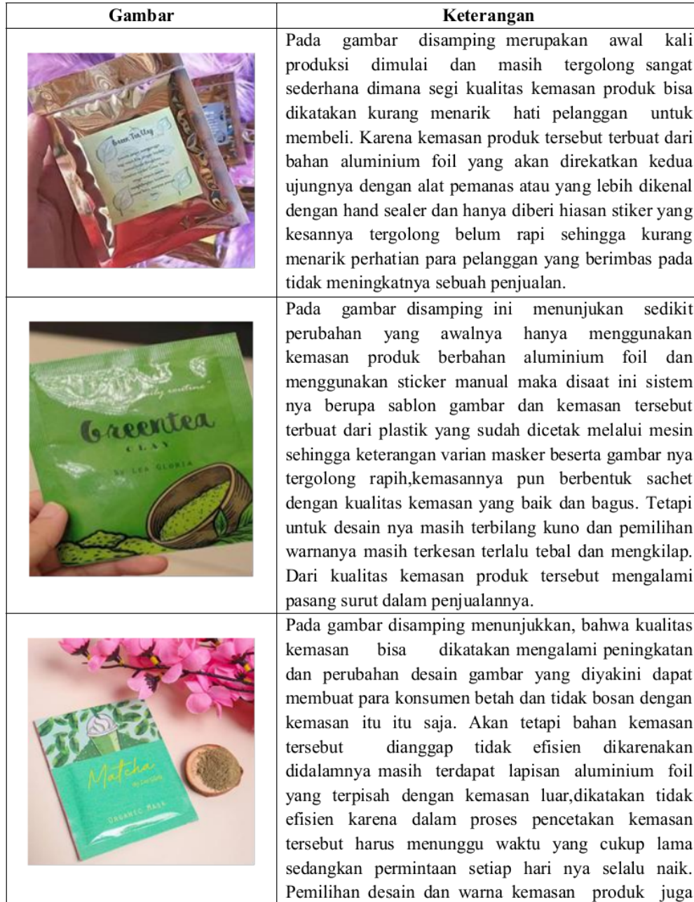
Tabel 1. Kemasan Produk

proses pencetakan kemasan memerlukan waktu yang cukup lama. Lalu yang terakhir pada gambar ke 4 mengalami perubahan kualitas kemasan produk yang sudah lebih efisien, ringan, dan terlihat lebih elegan dan juga tertera nomor legalitas dari pihak Badan Pengawas Obat dan Makanan (BPOM). Sehingga pada kemasan yang baru ini mengalami peningkatan pada penjualan karena desain kemasan produk lebih menarik.