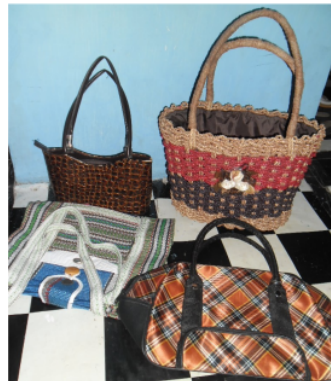
ANYAMAN TAS DARI BAHAN TUMBUHAN DAN KAIN