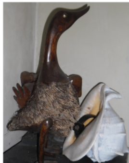
HIASAN DINDING DARI BAHAN KAYU BENANG DAN HEWAN LAUT