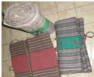
ANYAMAN TIKAR DARI BAHAN TUMBUH- TUMBUHAN